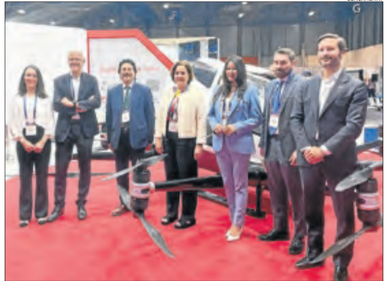
Autoritats i representants d'EHang a la fira de Madrid.

La investigació i el desenvolupament de drons es considera una peça clau de l'estratègia de la Generalitat per convertir Alguaire en un aeroport industrial. De fet, per facilitar proves amb aquests aparells Aeroports tanca de forma temporal la pista a avions de passatgers quan acull vols no tripulats. D'aquesta manera, deixa de ser un aeroport comercial i no està subjecte a les normes que regeixen durant el temps en què sigui escenari per a proves amb aquestes tecnologies.