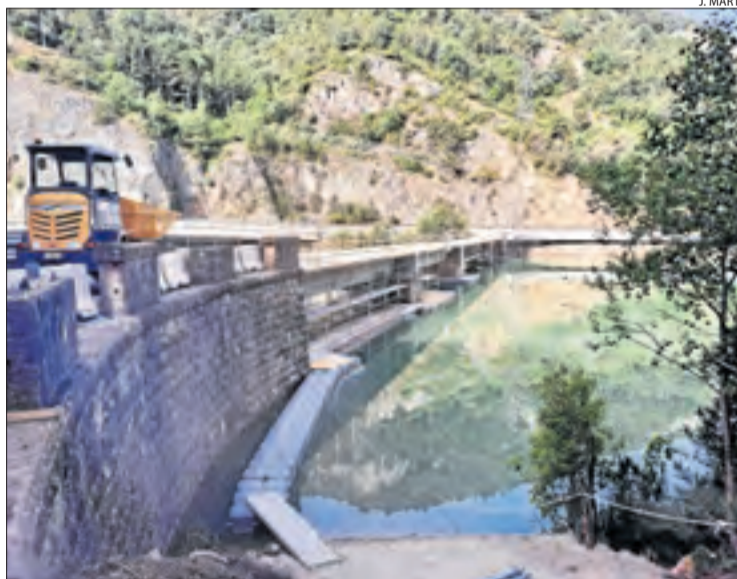
La base flotant sota del pont que està sent reformada.

La carretera local estarà tallada al trànsit fins a finals d'octubre i hi ha itineraris alternatius