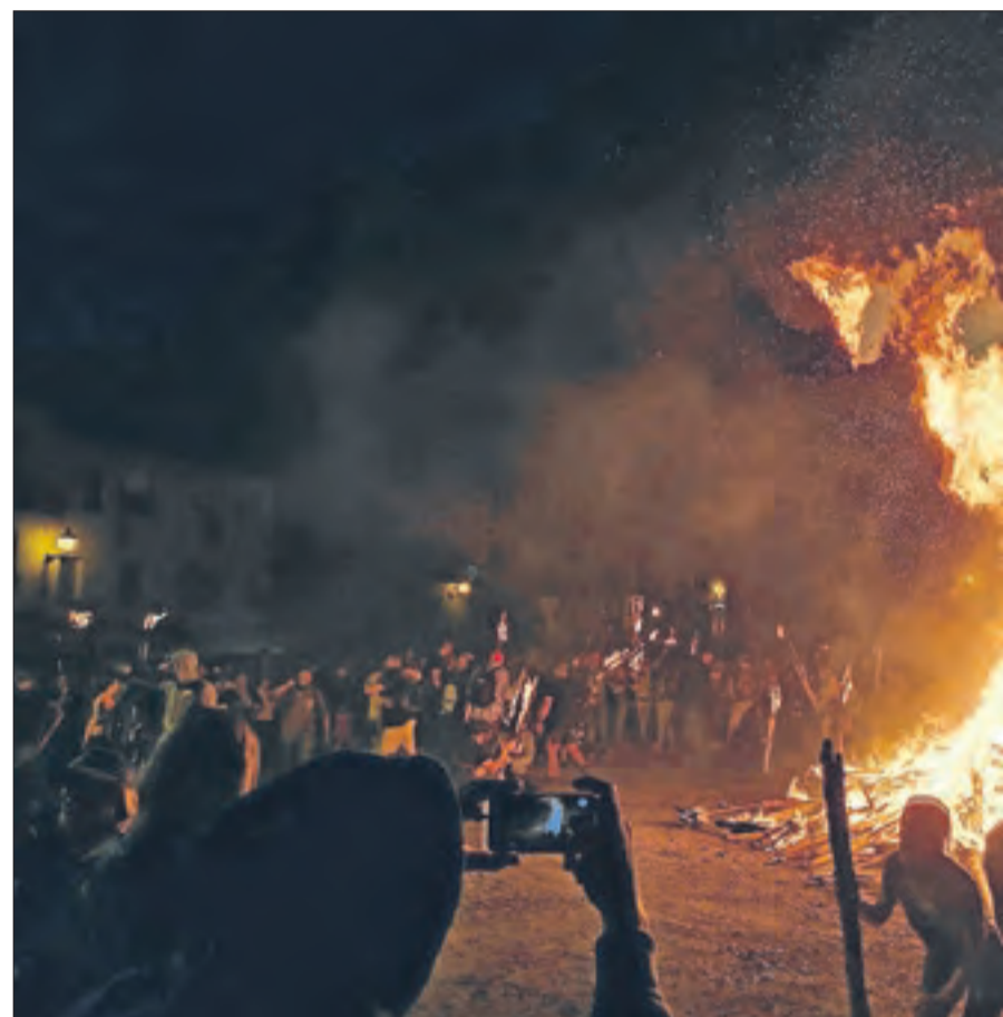
El Pont de Suert. La capital de l'Alta Ribagorça va ser fidel a la tradició i va viure una