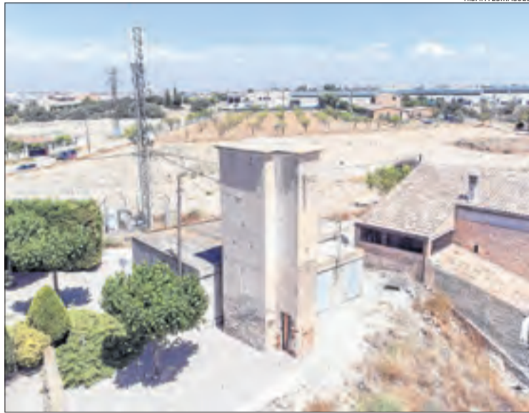
Imatge del dipòsit d'aigua de Fonolleres.