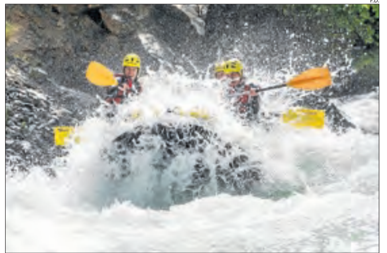
Una barca de ràfting a les aigües del riu Noguera Pallaresa.