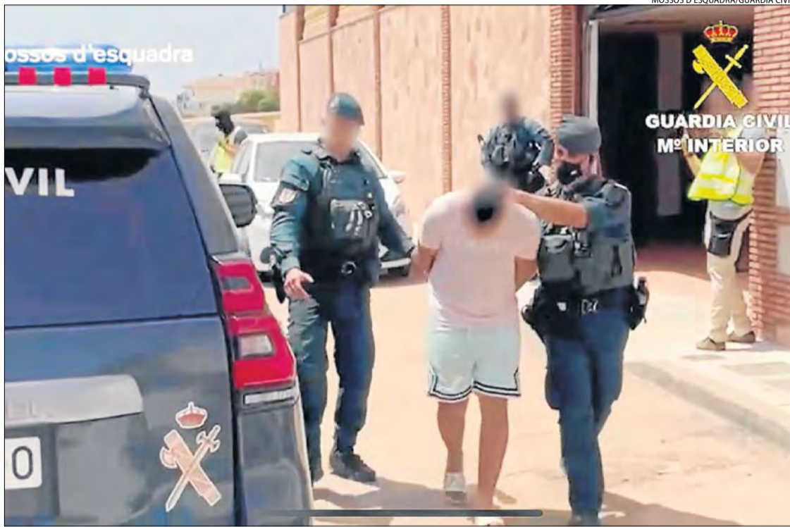
Un dels investigats, en el seu arrest el cap de setmana passat a Vélez-Málaga.

El passat 25 de maig, es va poder constatar que el grup que investigaven havia comès dos